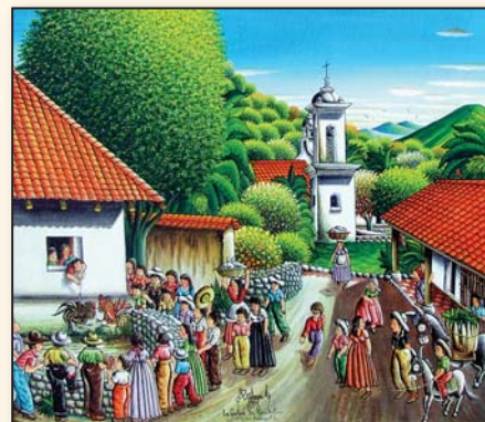
"קרב תרנגולים" של סליה - ZELAYA מהורם ה"נאיבי".

בתערוכה יוצגו כ-20 יצירות מתוך האוסף. האוסף שייך למשפחת מלצר אשר מעוניינת לחזק את הקשר בין שוחרי אמנות לבין אמני הונדורס. על אף שהונדורס נחשבת למדינה נחשלת, מיטב הציירים הגיעו ממנה. משפחת מלצר מעוניינת לשתף בקסם שביצירות של הציירים החשובים הללו.